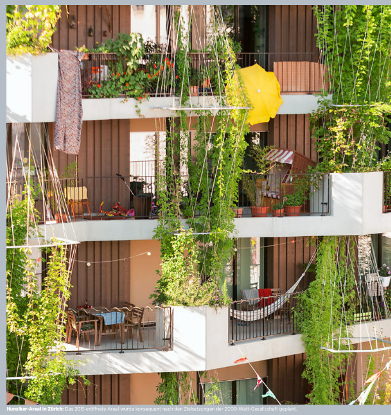
Hunziker-Areal in Zürich: Das 2015 eröffnete Areal wurde konsequent nach den Zielsetzungen der 2000-Watt-Gesellschaft geplant.