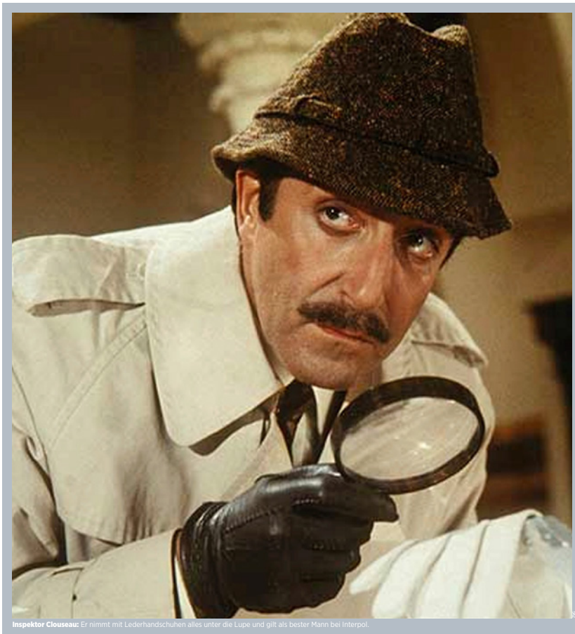
Inspektor Clouseau: Er nimmt mit Lederhandschuhen alles unter die Lupe und gilt als bester Mann bei Interpol.